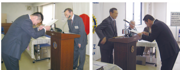
フレッシュマン研修セミナーに参加した会員に修了書が渡されました

ボーイスカウトから、40周年記念式典の参加者名簿が届きました。22名の方が出席していただけたということです。できるだけ多くの方にロータリークラブの活動を見ていただきたいと思います。